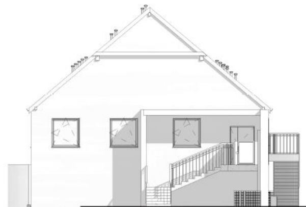
4 Południowa 1 : 100