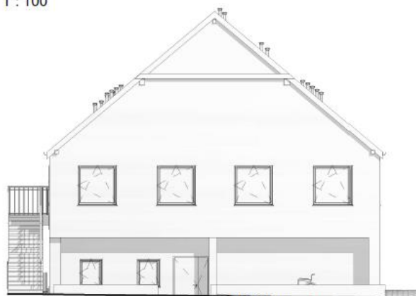
3 Północna 1 : 100