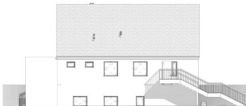
2 Wschodnia 1 : 100