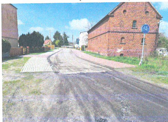
Widok na ulicę Adama Asnyka:

Czy gminę Szczaniec (zarządcę nieruchomości) stać na takowe zmiany?